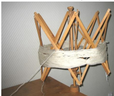
Nystvinda med garnhärva.

Om garnet är på härva måste du börja med att göra ett nystan. Öppna härvan och trä den över armarna på en medhjälpare, över två motställda stolsrygggar eller på en nystvinda. Nystvindor finns av olika modeller och är mycket praktiska.