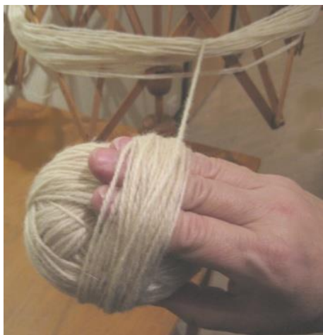
Lägg några fingrar emellan.

Ullgarn skall nystas löst för att inte tappa elasticiteten. Börja med att nysta runt en pappbit, byt vilken ledd du snor garnet med jämna mellanrum. Lägg några fingrar mellan nystanet och garnet för att det inte skall bli för hårt.